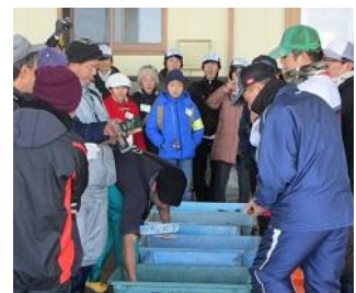
▲答志島でセリを取材