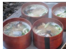
▲豪快なワッパ飯(粟島)