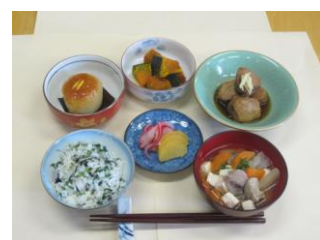
▲神奈川の郷土料理