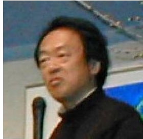
▲ゲストの池上彰先生 (2001)