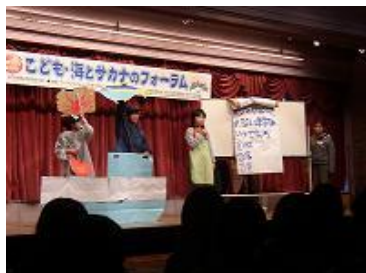
▲こども記者の発表