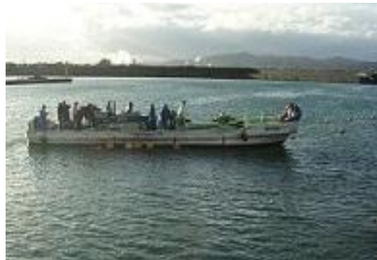
▲海の森づくりに加わる（富山・新湊）