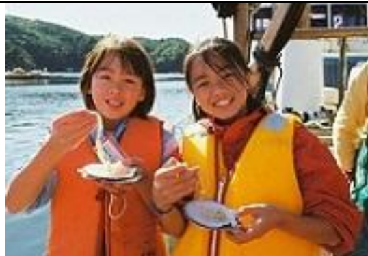
▲とれたての海の幸を味わう（宮城・女川町）