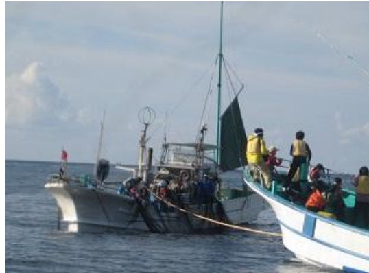
▲漁業を見学する（八丈島／ムロアジ漁）