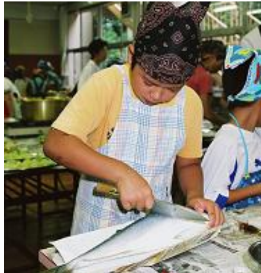
▲魚を自分でさばく（於. 東京／氷見のブリ）